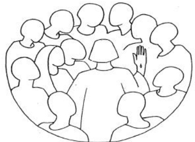
Mostrò loro le mani e il fianco. E i discepoli gioirono al vedere il Signore Giovanni 20,20

Otto giorni dopo i discepoli erano di nuovo in casa e c'era con loro anche Tommaso. Venne Gesù, a porte chiuse, stette in mezzo e disse: «Pace a voi!».