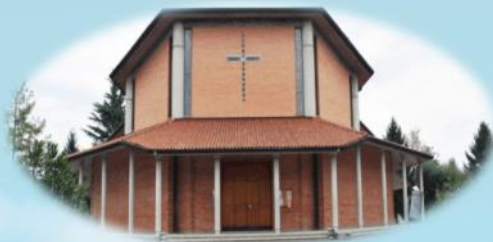
Parrocchia San Giuseppe - Borgomeduna