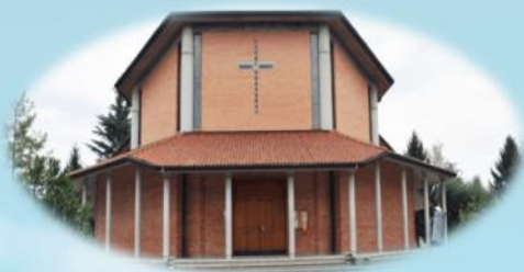
Parrocchia San Giuseppe - Borgomeduna